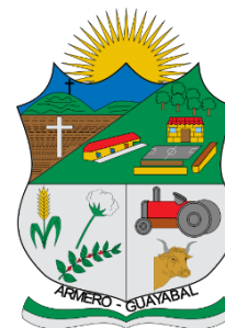
MUNICIPIO DE ARMERO-GUAYABAL TOLIMA