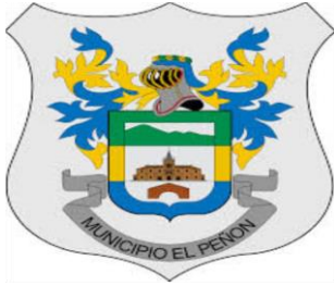
MUNICIPIO DE EL PEÑÓN - CUNDINAMARCA