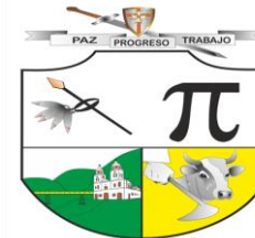
MUNICIPIO DE CAJAMARCA - TOLIMA