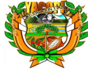
MUNICIPIO DE YACOPI - CUNDINAMARCA