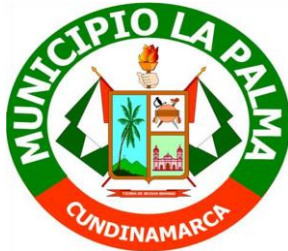
MUNICIPIO DE LA PALMA CUNDINAMARCA