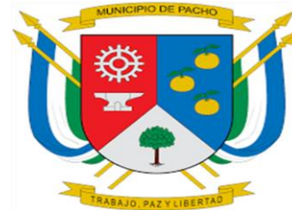
MUNICIPIO PACHO - CUNDINAMARCA