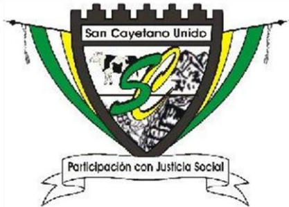
MUNICIPIO DE SAN CAYETANO - CUNDINAMARCA