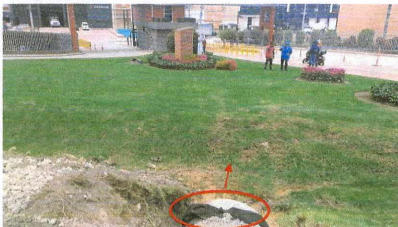
Vista de frente tubo ubicado en dirección vallado frente PIT - Área de influencia y riesgo e inundación PIT

Sobre este aspecto y teniendo en cuenta la competencia por parte del municipio, sobre el mantenimiento de este vallado e información de la gestión al respecto, con las dependencias al interior de la administración Municipal; así como el resultado de la coordinación de acciones conjuntas con la empresa ARCO CONSTRUCORA encargada de la adecuación de la vía, quienes nos manifestaron también adelantar gestiones con el municipio al respecto.